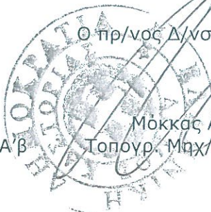
Μόκκας Ανδρέας Τοπογρ. Μηχ/κός με Α'β Msc