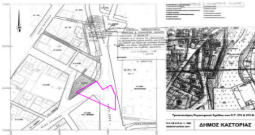
ΑΠΟΣΠΑΣΜΑ ΤΡΟΠΟΠΟΙΗΣΗΣ ΕΓΚΕΚΡΙΜΕΝΟΥ ΡΥΘΜΟΤΟΜΙΚΟΥ ΣΧΕΔΙΟΥ ΚΑΣΤΟΡΙΑΣ ΣΤΑ Ο.Τ.274 & 274B (Π.Δ. 2/12-6-2012 (ΦΕΚ 213/Α.Α.Π./14-06-2012)) Κλίμακα 1:200