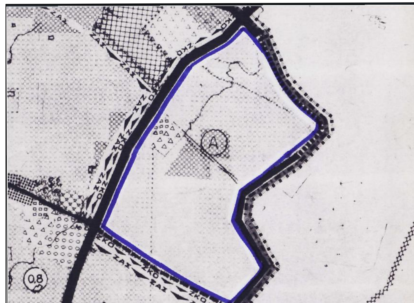
ΑΠΟΣΠΑΣΜΑ ΓΕΝΙΚΟΥ ΠΟΛΕΟΔΟΜΙΚΟΥ ΣΧΕΔΙΟΥ* (ΥΑ 4581/754/07.02.91, ΦΕΚ 84Δ/22.02.1991), ΚΛΙΜΑΚΑ 1:5000

*Με την ανωτέρω Υπουργική Απόφαση, αποκαρκτηρίζεται η περιοχή που είχε καθοριστεί ως ΖΕΠ με την παράγραφο 8, της ενότητας Α, της υπ' αριθμ. 40462/2020/26.06.1987 απόφασης ΥΠΕΧΩΔΕ (ΦΕΚ 142Α/1987), και καθορίζεται ο αυτήν χρήση οικιστικής κατοικίας.