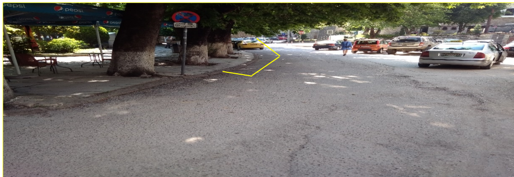
(σχ. 1 Υφιστάμενη πιάτσας ΤΑΞΙ- πλατεία Ειρήνης)

Έχοντας υπόψη την σύμβαση κατασκευής του έργου «Εξωραϊσμός πλατειών Μακεδομάχων και Ειρήνης» και την εργολαβία που υλοποιείται, σύμφωνα με την οποία θα εκτελεστούν εργασίες διαμόρφωσης του χώρου των πλατειών Ειρήνης & Μακεδονομάχων στην πόλη της Καστοριάς, προκύπτει η ανάγκη προσωρινής μεταφοράς της πιάτσας των ΤΑΞΙ από το σημείο που βρίσκονται τώρα (σχ.1), παραπλεύρως της πλατείας Ειρήνης