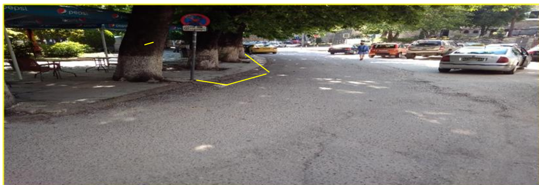
(σχ. 2 Πιάτσα ΤΑΞΙ (7 θέσεις)-πλατεία Μακεδονομάχων )

Στην παλαιότερη θέση τους παραπλεύρως της πλατείας Ειρήνης (σχ.2)