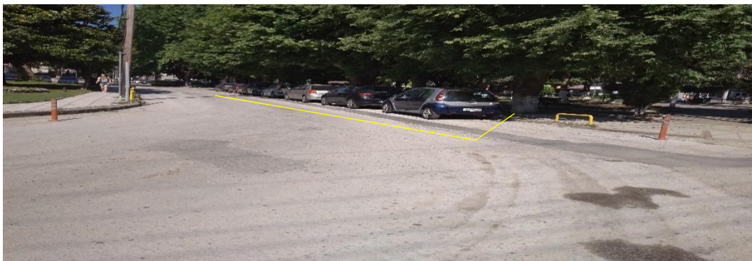
(σχ. 1 Υφιστάμενη πιάτσα ΤΑΞΙ- πλατεία Μακεδονομάχων )

Έχοντας υπόψη την σύμβαση κατασκευής του έργου «Εξωραϊσμός πλατειών Μακεδονομάχων και Ειρήνης» και την εργολαβία που υλοποιείται, σύμφωνα με την οποία θα εκτελεστούν εργασίες διαμόρφωσης του χώρου των πλατειών Ειρήνης & Μακεδονομάχων στην πόλη της Καστοριάς, προκύπτει η ανάγκη προσωρινής μεταφοράς της πιάτσας των ΤΑΞΙ από το σημείο που βρίσκονται τώρα (σχ.1), παραπλεύρως της πλατείας Μακεδονομάχων.