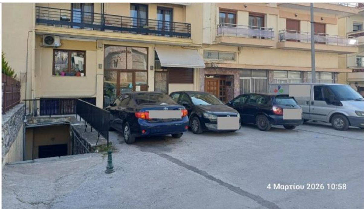
1. Φωτογραφική αποτύπωση/σκαρίφημα προτεινόμενης θέσης στάθμευσης ΑμεΑ

Εισηγείται προς το Δημοτικό Συμβούλιο την έκδοση κανονιστικής απόφασης σχετικά με την παραχώρηση δικαιώματος χρήσης θέσης στάθμευσης Ι.Χ. αυτοκινήτου ΑμεΑ επί της οδού Μητροπόλεως 113, στην Κοινότητα Καστοριάς, (πίσω από την Μητρόπολη στο αδιέξοδο), όπως αποτυπώνεται στις παρακάτω φωτογραφίες.