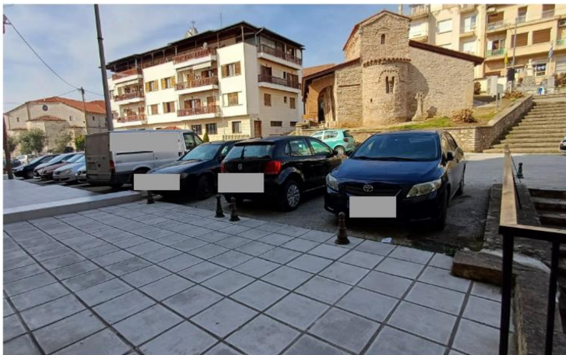
2. Φωτογραφική αποτύπωση/σκαρίφημα προτεινόμενης θέσης στάθμευσης ΑμεΑ