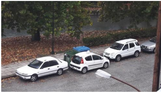
Στάθμευση μπροστά σε κάδο απορριμμάτων