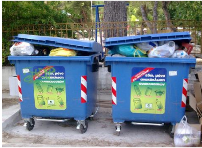
Σύμμεικτα απορρίμματα σε κάδους ανακύκλωσης