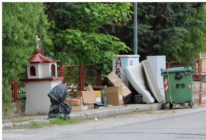
απόρριψη ογκωδών αντικειμένων