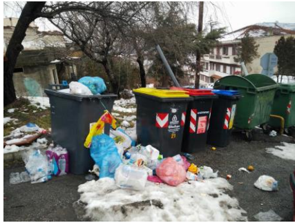
Απόρριψη σκουπιδιών εκτός κάδων