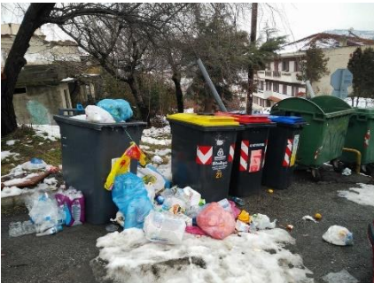
Απόρριψη σκουπιδιών εκτός κάδων