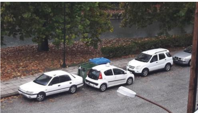
Στάθμευση μπροστά σε κάδο απορριμμάτων