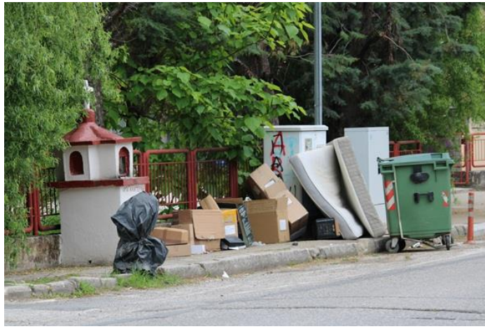
απόρριψη ογκωδών αντικειμένων