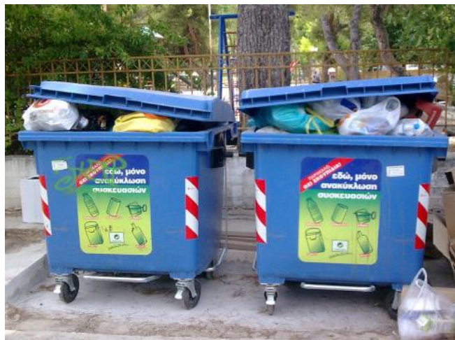
Σύμμεκτα απορρίμματα σε κάδους ανακύκλωσης